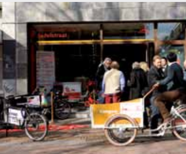
BOVEN: FIETSPARKEERVAKKEN AAN DE TWIJNSTRAAAT MET 'NIETJES'. BEDOELD VOOR KORTPARKEREN.