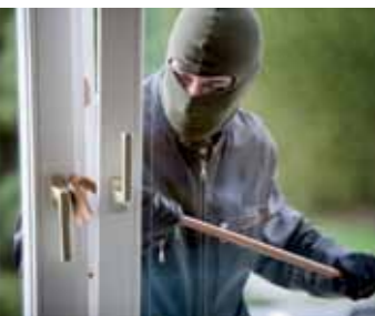
INBREKER AAN HET WERK.