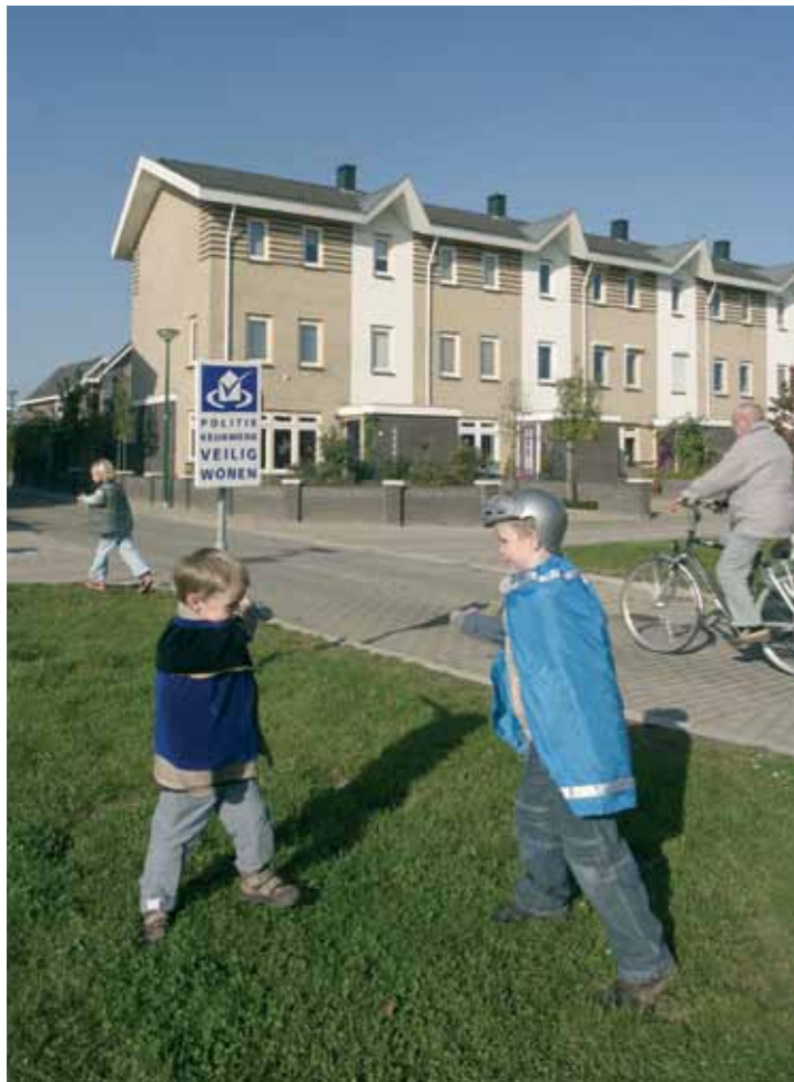
PKVW BORD IN WOONWIJK.