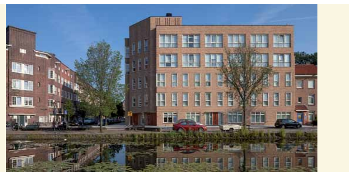
TRANSVAALKADE, GROEPSWONINGEN OUDEREN.