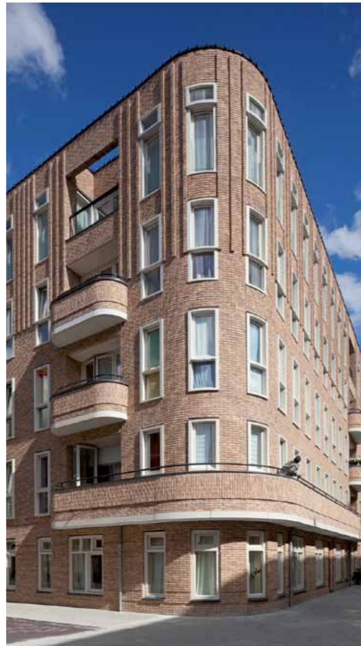
HOFMEYRSTRAAT, HOEK- EN KOPGEVEL.

NA RUIM ZES JAAR VOORBEREIDING EN BIJNA ANDERHALF JAAR UITVOERING, IS EIND 2013 DE 'KRAAIPAN' OPGELEVERD. ONTWERPEN IN HET IDIOOM VAN DE AMSTERDAMSE SCHOOL HERBERGT HET COMPLEX DIVERSE WOONVORMEN – VOOR DEMENTERENDE OUDEREN, SCHIZOFRENE JONGVOLWASSENEN EN OUDEREN VAN MAROKKAANSE AFKOMST. 'KRAAIPAN' HEEFT DE ZUIDERKERKPRIJS GEWONNEN EN IS GENOMINEERD VOOR DE AMSTERDAMSE ARCHITECTUURPRIJS 2014.