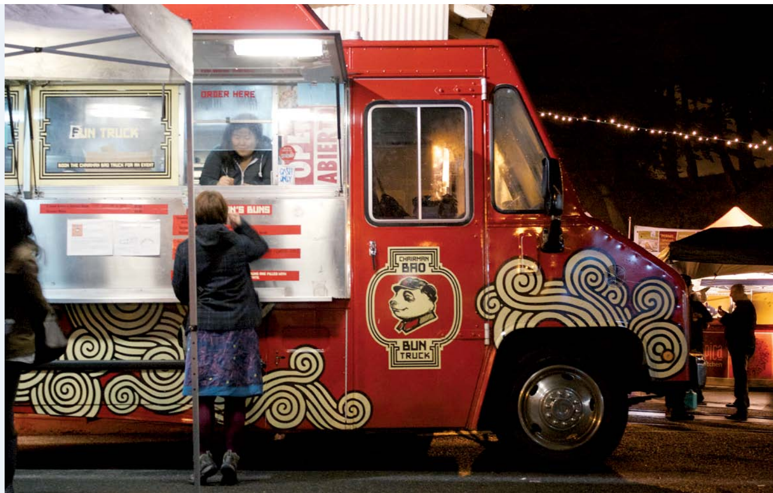
OFF THE GRID IN VS. TIJDENS OFF THE GRID KOMEN FOOD TRUCKS VOOR EEN PAAR UUR SAMEN. EEN DESOLAAT PLEIN VERANDERT ZO IN EEN BRUISENDE PLEK MET VOLOP CULINAIRE KEUZE.

WANDELLENDE HUIZEN, PLUG-IN-KANTOREN, WINKELS IN METROREINEN EN MEENEEM-ZEBRAPADEN: STEDEN STAAN DE LAATSTE JAREN BOL VAN DE POP-UP-CONCEPTEN. NET ZOALS EEN POP-UP-VENSTER OP JE PC OPEENS VERSCHIJNT EN OOK WEER MAKKELIJK WEGGEKLIKT KAN WORDEN, WORDT DOOR VEELAL JONGE STEDENBOUWERS, ARCHITECTEN EN PLANOLOGEN GEZOCHT NAAR STEDELIJKE OPLOSSINGEN DIE NIET PER SE BLIJVEND ZIJN, MAAR EEN VOORTDUREND VERAN- DERENDE SITUATIE ALS STARTPUNT NEMEN. ALS HUN TIJD VOORBIJ IS VERDWIJNEN ZE OOK WEER. HET GAAT HIER NIET ALLEEN OM TIJDELIJKE INVULLING VAN LEEG- STAAND VASTGOED, MAAR VEEL BREDER OM HET INSPELEN OP VERANDERLIJKHEID BINNEN HET RUIMTELIJK ONTWERP.