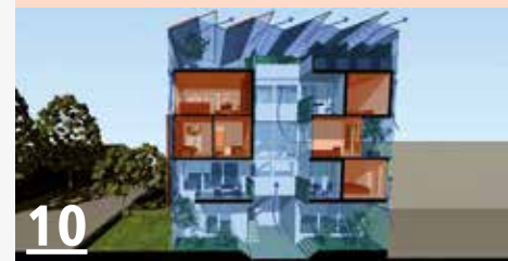
DRIE MENSEN GAAN IN HET NIEUWE JUBI GEBOUW IN DEN HAAG HET OVERDRUKTRAPPENHUIS BINNEN.